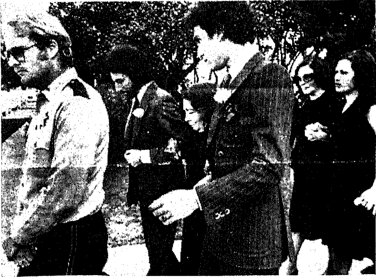
الملكة نازلى [ ٨١ سنة ] تمشى بين حفيدتها من الأميرة فتحية . . وهى فى طريقها إلى الكنيسة التى ستدفن فيها الأميرة فتحية . وتسير خلفها الأميرتان فايزة وفايقة .